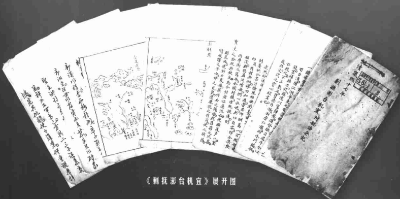
《剿抚澎台机宜》展开图

该文献形成于1685年（清康熙二十二年），共1件，保存在北京市档案馆。此文献系有关17世纪清代统一澎湖、台湾的重要文献，主要为对澎台郑氏政权剿抚政策和策略的建议，其中包括海图、条约十二则、杂记十七则以及匾对赠言等。描绘了福建沿海和澎台一带地势、详列了澎台岛屿、山川、风俗、民情以及台风的发生规律。该文献是研究清朝对郑氏政权政策的形成与发展的宝贵史料。